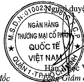
Hạng: Tổng Giám đốc Giám đốc

Các thuyết minh đính kèm là bộ phận hợp thành của báo cáo tài chính riêng giữa niên độ này